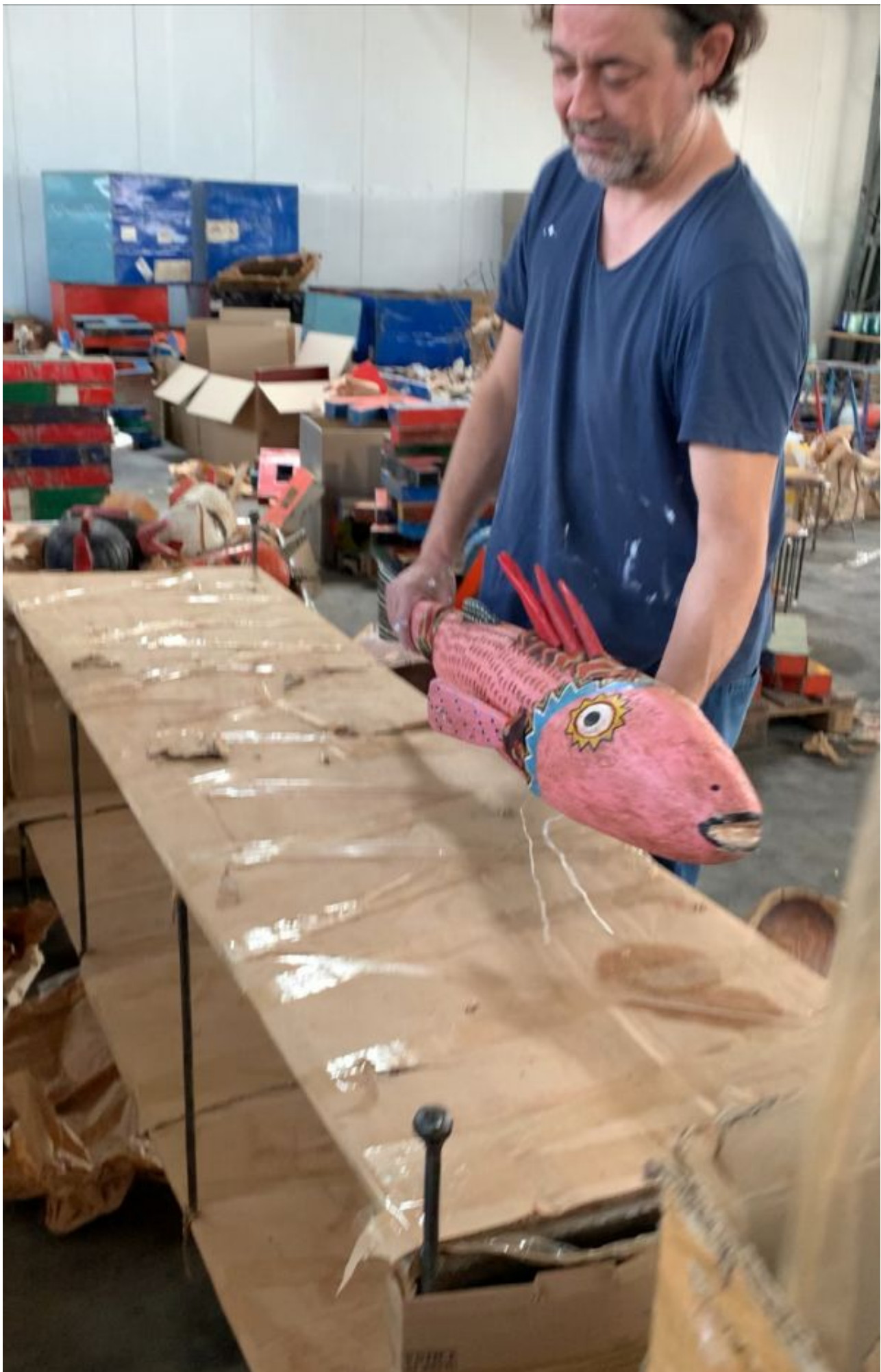
Am 1. Juli war es soweit! Wir konnten unsere neue Thekenerganzung bei unserem Fairhandelspartner