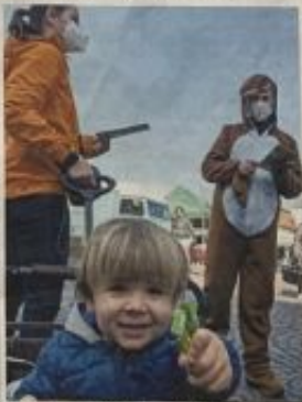
Auf dem Dieburger Marktplatz wurde jetzt Süßigkeiten von Walden-Mitarbeiter in Kaschortkürzen verteilt. Die Süßigkeiten sind fair gehandelt.